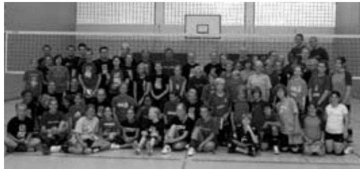
Die Teilnehmer an der Volley-Woche in Hamburg