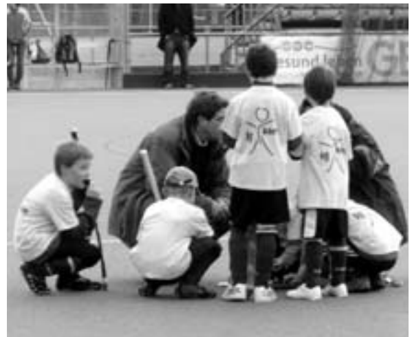
Taktische Besprechung in der Halbzeit in Stuttgart