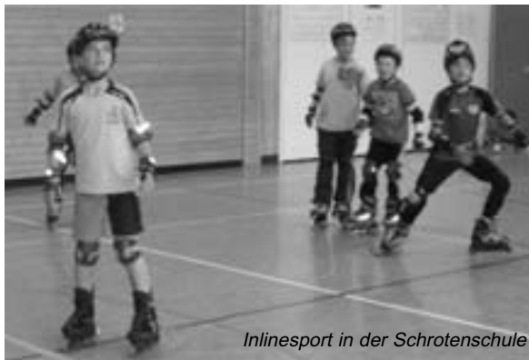
Inlinesport in der Schrotenschule