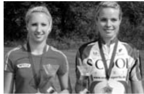
Im Weltcup erfolgreich: Alessandra Veit und Jana Börsig