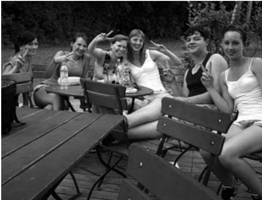
Die Tuttlinger Tänzer beim Klettern und danach im Fußballfieber!

nur für Adrenalin pur, sondern auch durchaus für Muskelkater an den darauffolgenden Tagen. Die weitaus meisten von uns waren aber deutlich realistischer und ließen es wohl dosiert angehen. Da jeder Parcours eine Besonderheit hatte, konnte man schließlich auch beim dritten, blauen Parcours „etwas erleben“.