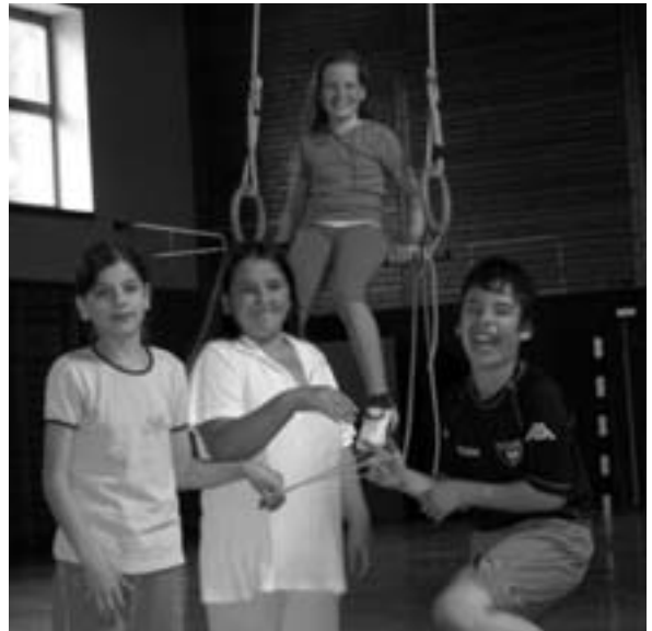
Turnen in der Hermann-Hesse-Realschule