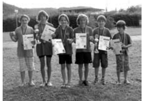
Die Erstplatzierten bei den Stadtmeisterschaften

Helferinnen im Skaterpark getroffen. Die Kids hatten dort eine Menge Spaß und vergaßen dabei die Zeit. Die Eltern waren in die Eisdiele Venezia bestellt, wo man sich gemeinsam zum Abschluss noch eine leckere Eisvariation schmecken ließ.