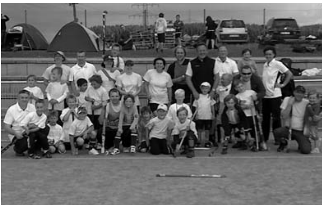
Eltern-Kind-Hockey in Vaihingen