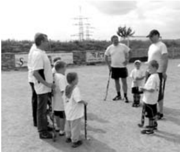
Die Hockeyspieler aus Tuttlingen begrüßen ihre Freunde aus Vaihingen

Hockeyfieber alle angesteckt, Kinder und Eltern. So kam es sehr gelegen, dass der Club an der Enz in Vaihingen uns zu einem Eltern-Kind-Hockeytag einlud. Die Eltern erhielten die Gelegenheit auch mal den Hockeyschläger in die Hand zu nehmen, in den Sport hineinzuschnuppern und mit den eigenen Kindern auf dem Feld zu spielen. Die Teilnahmebereitschaft der Eltern hat unsere Erwartungen übertroffen. Wir „Eltern“ hatten so viel Spaß dabei, dass wir am Ende die Kinder auf die Zuschauertribüne verbannten und unter uns Tuttlinger Eltern ein Spiel machten. Nun