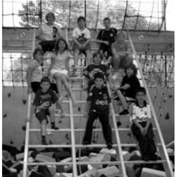
Sport-Mix in der Ludwig-Uhland-Realschule

Spiel und Spaß an der Bewegung stehen im Vordergrund, und so ist das Sportangebot heiß begehrt. Fetziges Turnen mit und ohne Geräte, Ballspiele, neue und alte Spiele, Wasserspiele, Inlineskating, Slackline und vieles mehr werden angeboten. An der Ludwig-Uhland-Realschule und der Hermann-Hesse-Realschule hatten wir auch ein abwechslungsreiches Programm wie Sicherheitstraining für Inline-Skater, Fußball, Handball, Basketball, Bungee-Lounge und Trampolin. Für jeden ist da etwas Interessantes dabei. Die Schüler konnten die Stunden mitgestalten, so konnte jeder seine Ideen und Anregungen mit einbringen. An den Grundschulen wurden den teilnehmenden Kindern bei einer Abschlussveranstaltung ihre Urkunden und