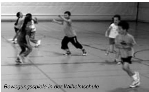
Bewegungsspiele in der Wilhelmschule

Sportpässe sowie kleine Geschenke von Badenova überreicht. Die Firma KARL STORZ Endoskope unterstützt das Projekt in der Schrotenschule, so dass die Mitarbeiterinnen die Ganztagesbetreuung für die Schüler interessant gestalten können. Auch an den Realschulen gab es ein Geschenk von Badenova. Die Arbeit mit den Kindern hat uns wie jedes Jahr sehr viel Spaß gemacht und es war eine abwechslungsreiche Zeit.